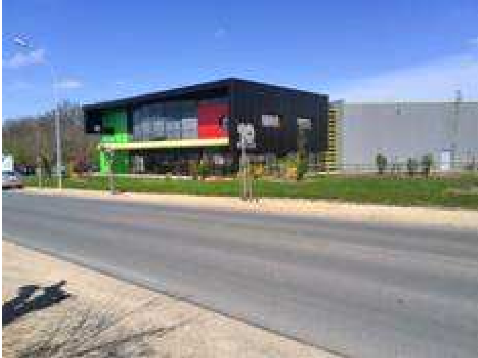
(Les nouveaux locaux de TEN FUTUROSCOPE à NEUVILLE de POITOU)

C'est désormais à une nouvelle adresse que vous pourrez profiter de nos hôtes. Les numéros de téléphone et de fax restent les mêmes qu'auparavant.